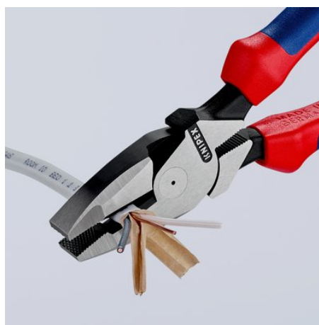
Продольное резание для разделения плоских кабелей