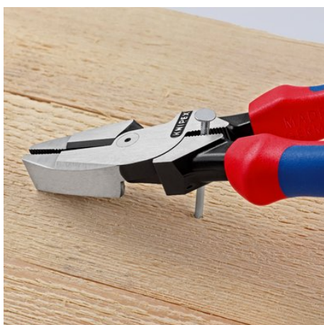
Область захвата под шарниром для мощного рычажного усилия